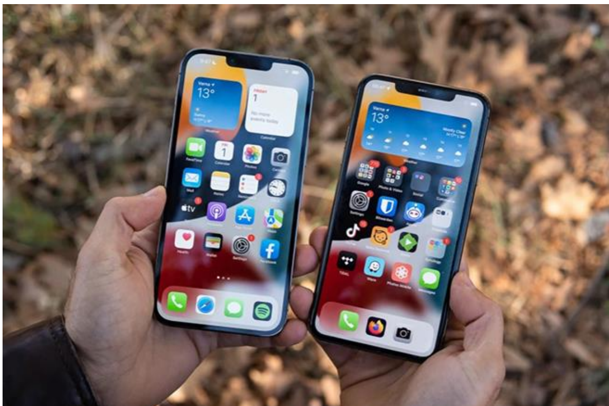
iPhone 13 Pro Max có "tai thỏ" nhỏ hơn.

Nếu đang sử dụng iPhone 11 Pro Max, người dùng sẽ ngay lập tức nhận thấy iPhone 13 Pro Max là một chiếc điện thoại lớn và nặng hơn về tổng thể. iPhone 13 Pro Max có các cạnh phẳng so với các cạnh cong trên iPhone 11 Pro Max. Thiết kế này nhìn rất đẹp nhưng cũng khiến điện thoại khó cầm hơn một chút, đặc biệt nếu bạn có bàn tay nhỏ.