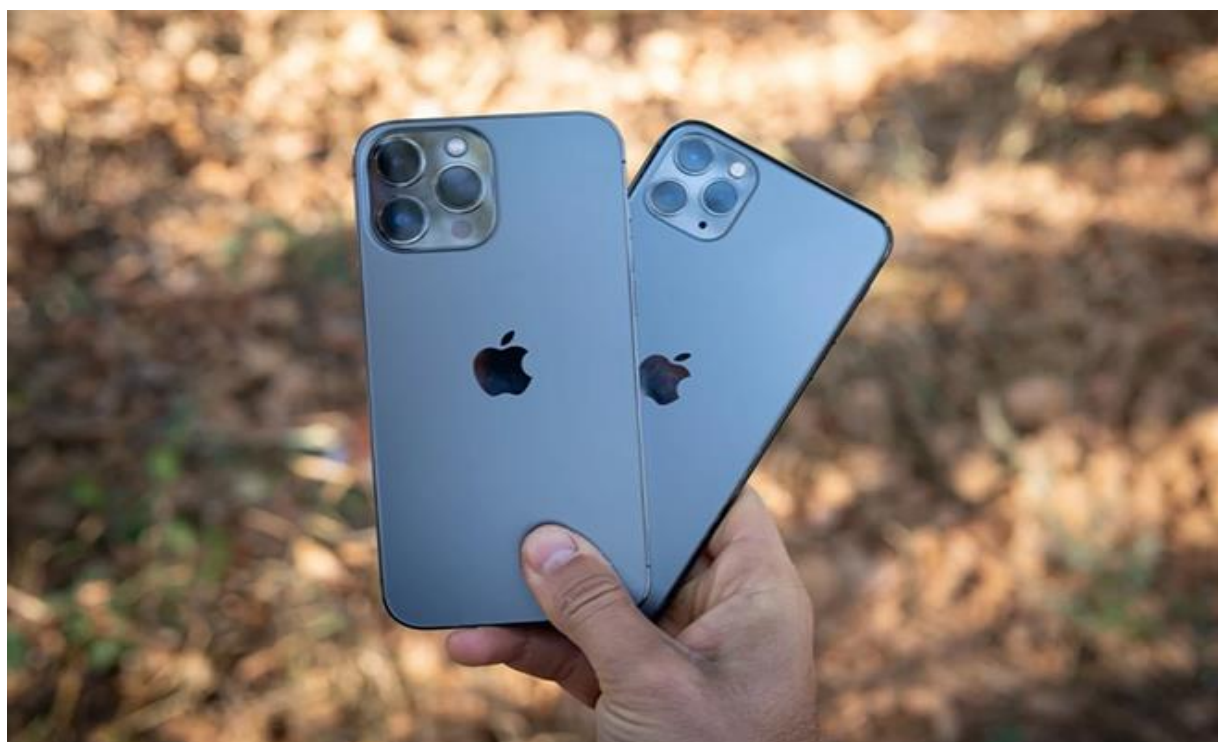
Camera trên iPhone 13 Pro Max được nâng cấp triệt để sau 2 năm.

Ở mặt sau, cặp iPhone Pro Max vẫn có ba camera: một camera chính, một ống kính siêu rộng và một ống kính zoom (zoom 3X trên iPhone 13 Pro Max và zoom 2X trên iPhone 11 Pro Max).