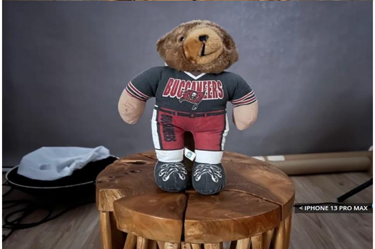
Ảnh chụp trong nhà.