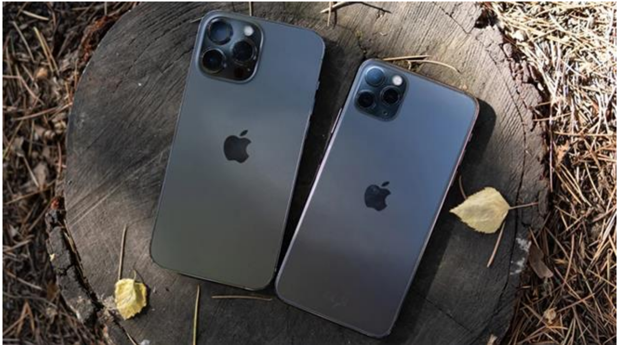
iPhone 13 Pro Max và iPhone 11 Pro Max.

Năm nay, iPhone 13 Pro Max mang đến nhiều tính năng được mong đợi: màn hình ProMotion 120Hz, camera được nâng cấp và có lẽ ấn tượng nhất là thời lượng pin tăng đáng kể. Vậy với giá chênh tới 9 triệu, iPhone 11 Pro Max (từ 26 triệu đồng) có khác biệt quá nhiều so với iPhone Pro Max 2021 hay không?