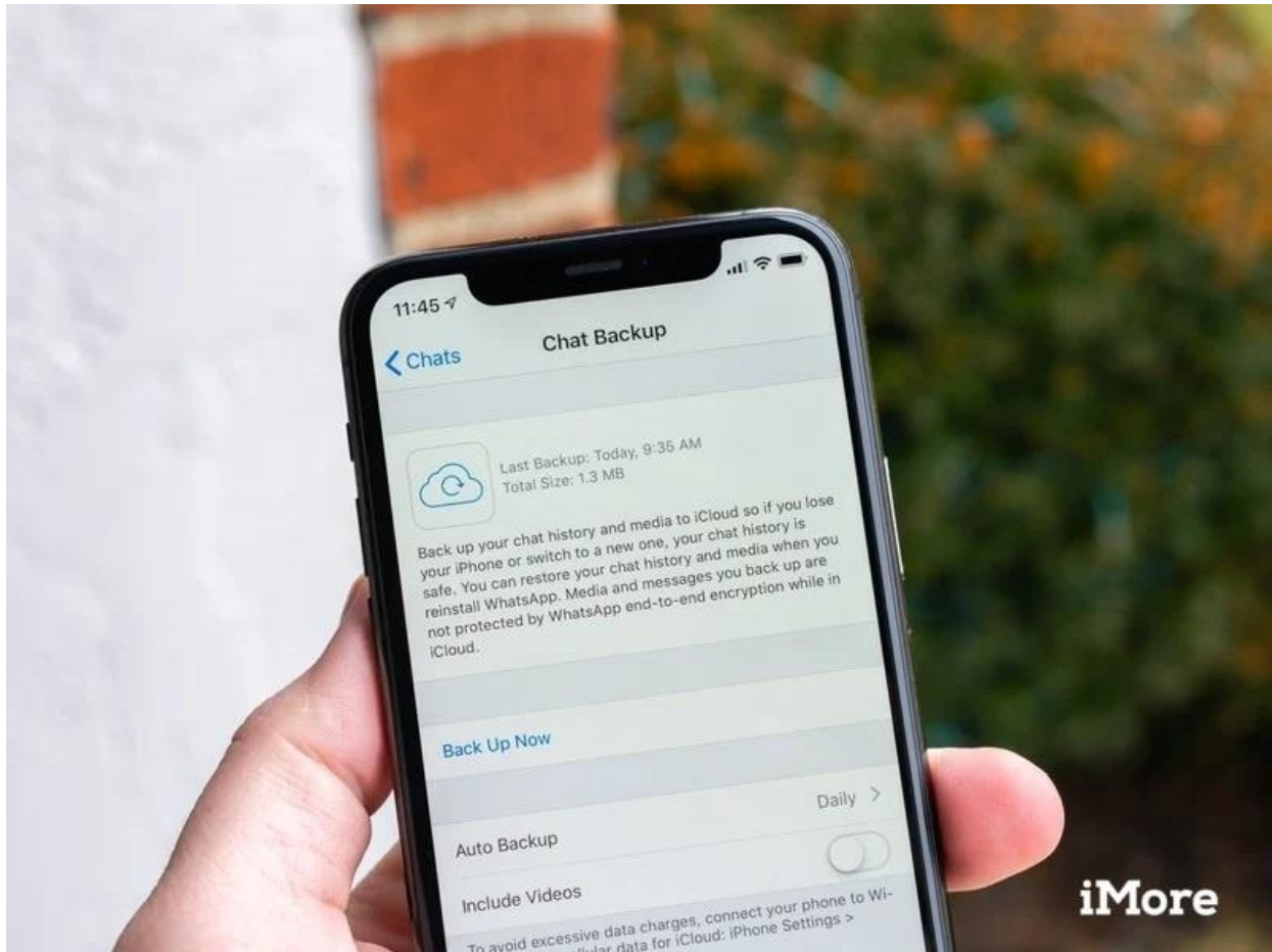
Đừng quên lưu trữ lại tin nhắn trước khi xóa dữ liệu.

- Mỗi ứng dụng sẽ có cách lưu trữ khác nhau, nhưng người dùng nên kiểm tra để đảm bảo đã sao lưu tại thời điểm gần nhất để không làm mất dữ liệu.